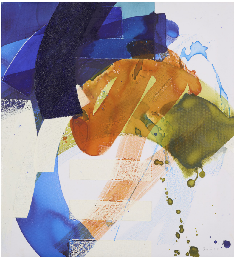
Véronique Zaech, sans titre, encre, pigments, pastel à l'huile, 59 x 54 cm 2023