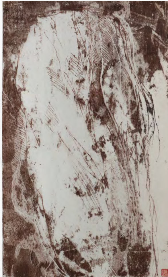
< Bloc erratique, 63 cm x 73 cm (monotype à l'huile)

C'est la première fois que la Galerie 2016 l'accueille en ses murs.