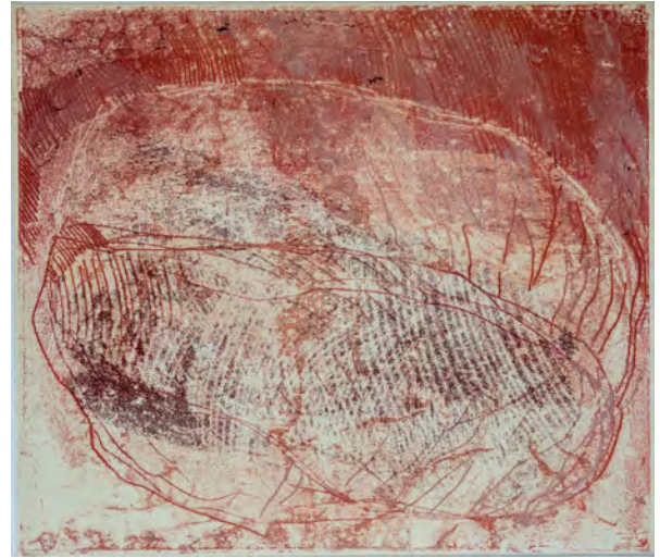
Bloc erratique, 63 cm x 73 cm - monotype à l'huile

Conservateur de la Fondation Ateliers d'Artiste