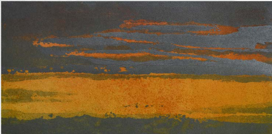
Soir d'orage, 18 cm x 35.5 cm (aquarelle)