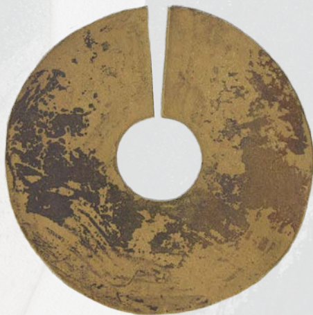
Sue, 19 cm de diamètre (aquarelle)