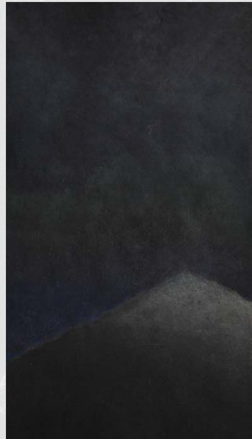
Hommage à Hokusai, les 36 vues du Niesen «Dans la nuit profonde, l'espace se laisse deviner» 50 cm x 29.5 cm (estampe japonaise, Moku Hanga)