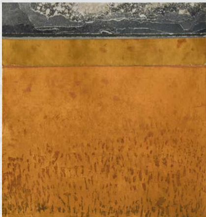
Au loin l'orage, 41.5 cm x 37.5 cm (collage)