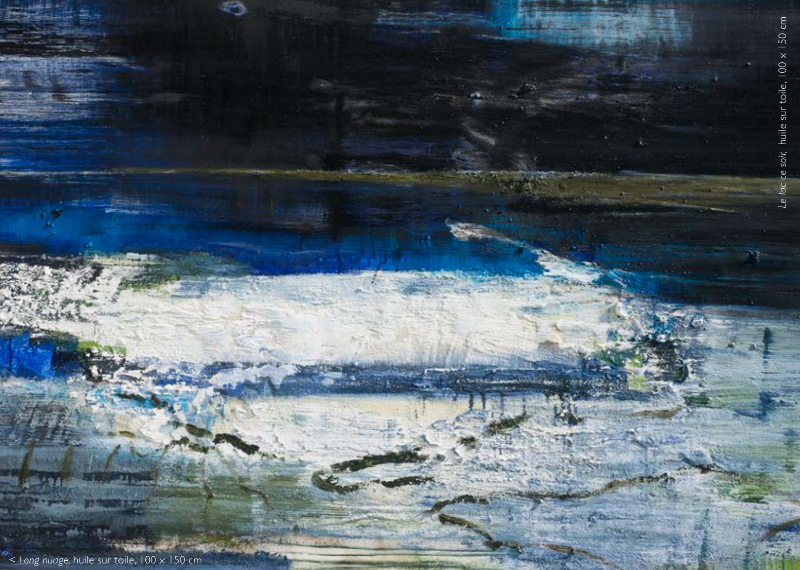
Le lac ce soir, huile sur toile, 100 x 150 cm