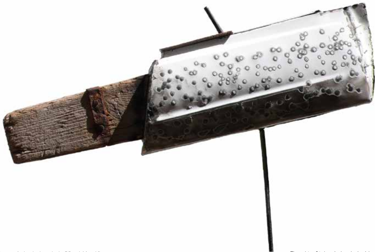
< The Mirror , métal, miroir et bois, 90 x 146 x 15 cm