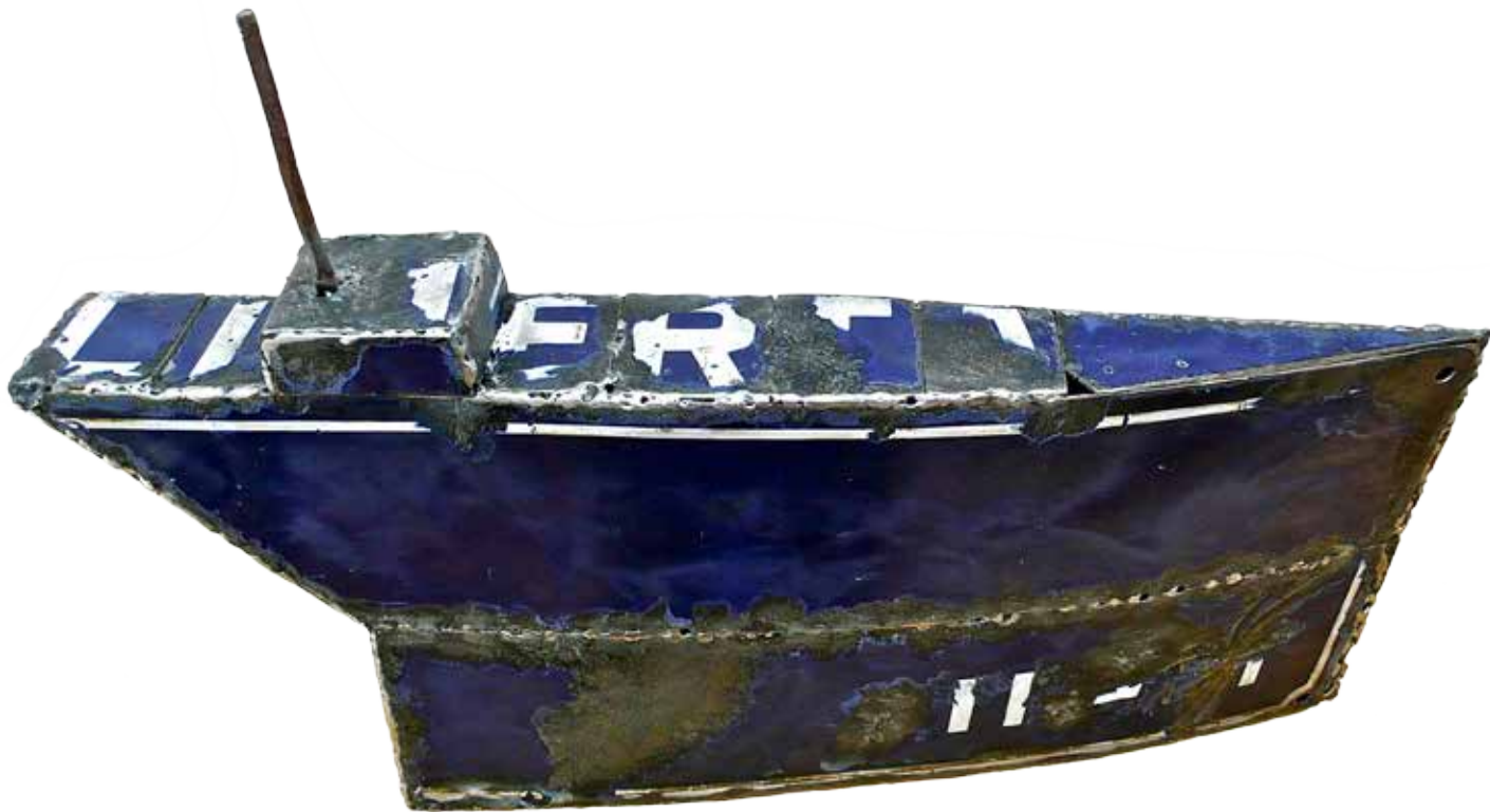
Liberta , acier émaillé, 51 x 35 x 7 cm