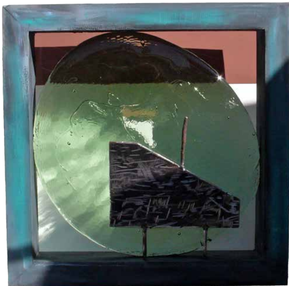
Glassmoon , acier, verre, bois, 40 x 40 x 6 cm

Phil Billen est né à Bruxelles en 1954. Études à l'Académie de Boitsfort et à l'Atelier 75 à Bruxelles. Ses domaines de prédilection sont le dessin, la peinture et la sculpture avec des matériaux divers comme le métal, le verre et le bois. Il a exposé aux États-Unis et en Europe. Vit et travaille à Vence, dans les Alpes-Maritimes depuis 1993.